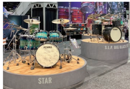
ショウブースの展示